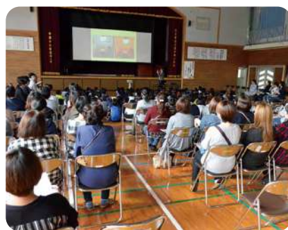
※写真は吉井南小学校での様子