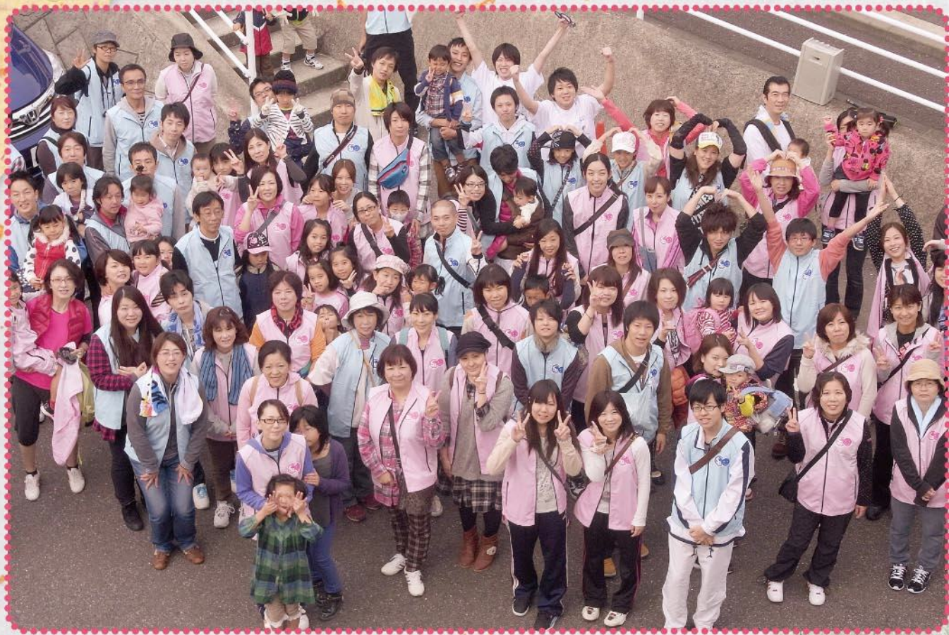
クリーンウォーキングを行いました (関連記事は4ページ)